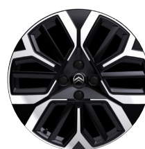
Max: 18" Amber -kevytmetallivanteet (195/60R18)