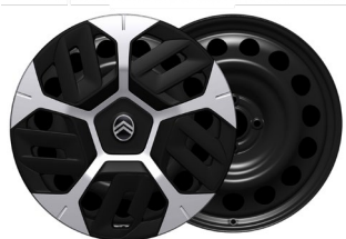
Plus: 18" teräsvanteet Aerotech –koristekapselin (195/60R18)