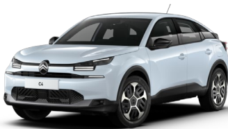
Blanc Okenite met.