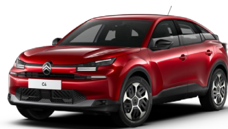
Rouge Elixir met.