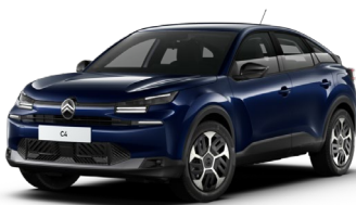
Blue Eclipse met.