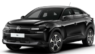
Noir Perla nera met.