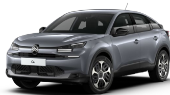
Gris Mercure met..