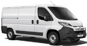
POPR | Ice White (perusväri)