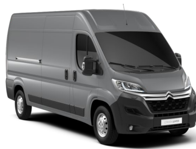
M0F4 | Gris Acier (metalliväri)