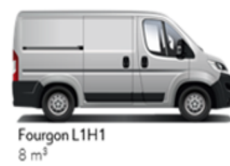
Fourgon L1H1 8 m³