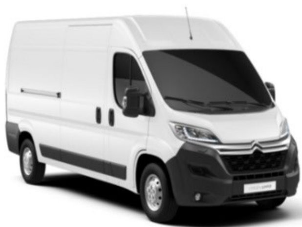
POPR | Ice White (perusväri)