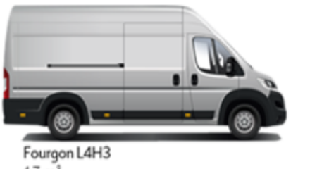
Fourgon L4H3 17 m³