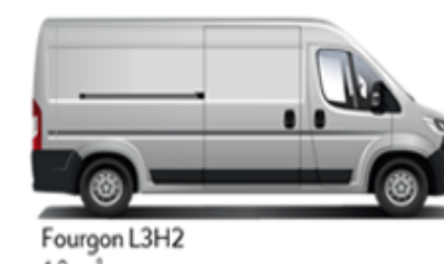
Fourgon L3H2 13 m³