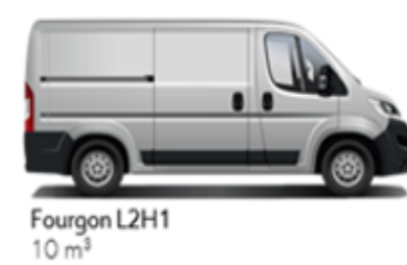
Fourgon L2H1 10 m³