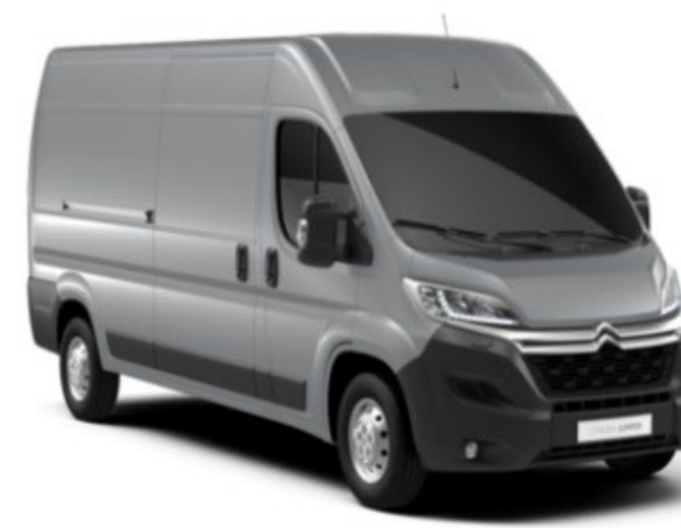
M0ZR | Gris Aluminium (metalliväri)