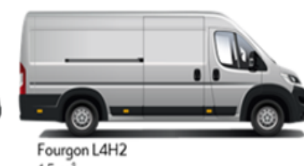
Fourgon L4H2 15 m³