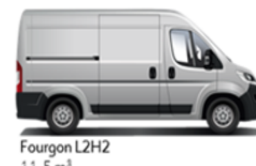
Fourgon L2H2 11,5 m³