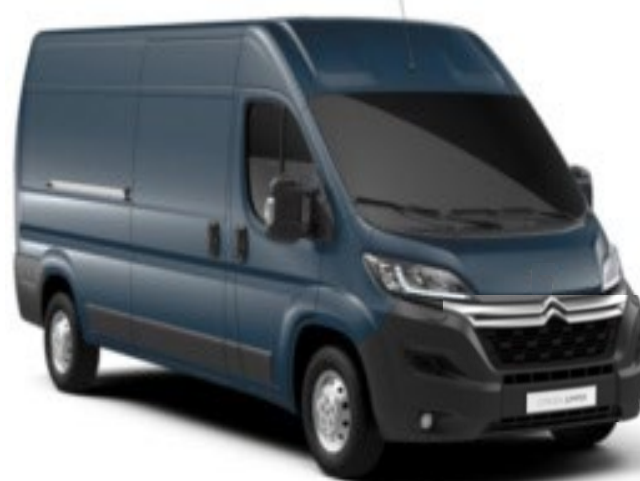
M0ZW | Gris Fer (metalliväri)