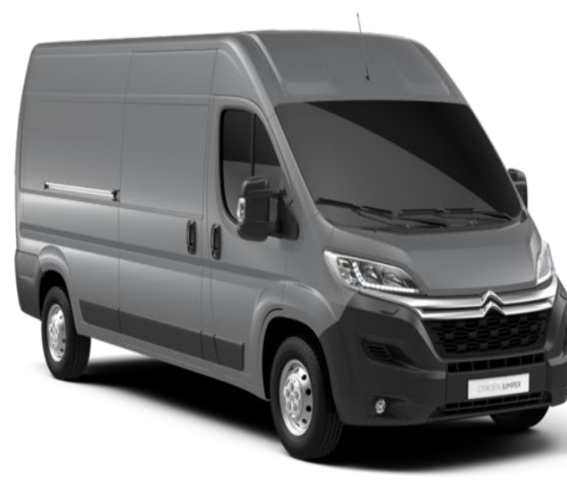
M0F4 | Gris Acier (metalliväri)