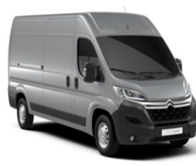
M0ZR | Gris Aluminium (metalliväri)