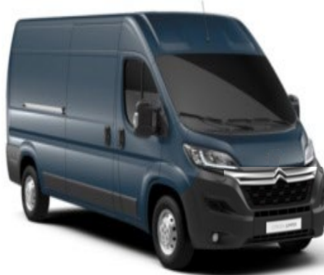
M0ZW | Gris Fer (metalliväri)