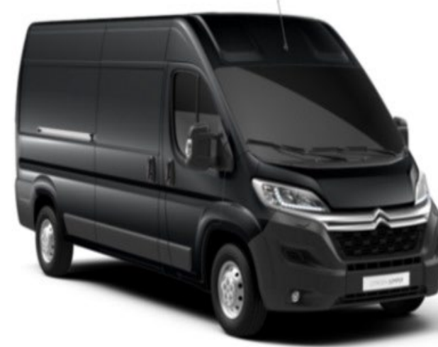
M0E9 | Gris Graphito (metalliväri)