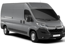
M0F4 | Gris Acier (metalliväri)