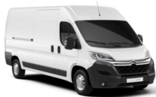
POPR | Ice White (perusväri)