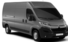
P02B | Gris Thunder (perusväri)