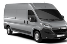
MOZR | Gris Aluminium (metalliväri)