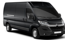
MOE9 | Gris Graphito (metalliväri)