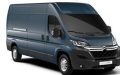
M02W | Gris Fer (metalliväri)