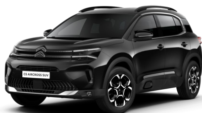
Noir Perla nera met.