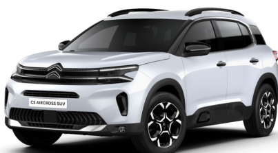
Blanc Okenite met.