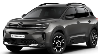
Gris Platiniium met