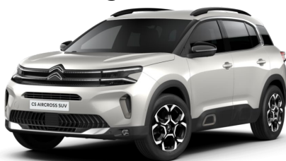
Blanc Nacre met.