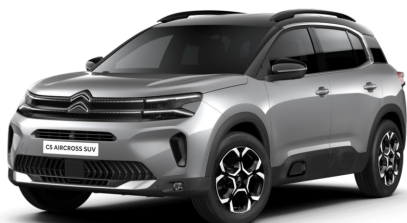
Gris Artence met.