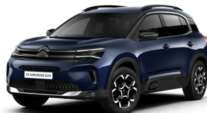
Blue Eclipse met.