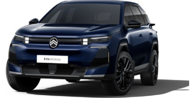
Blue Eclipse met.