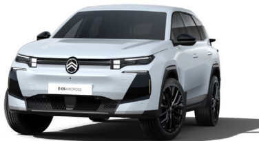
Blanc Okenite met.