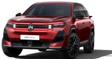
Rouge Rubi met.