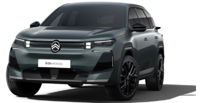
Vert Astoria met.