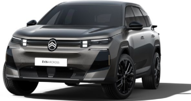
Gris Platinium met