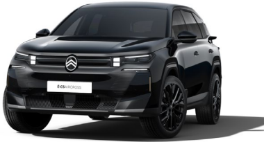
Noir Perla nera met.