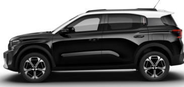
Noir Perla nera met.