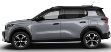
Gris Mercure met.