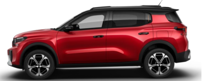
Rouge Elixir met.