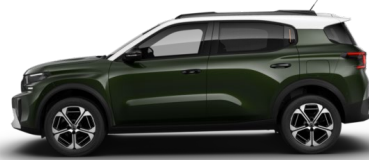
Vert Montana met.