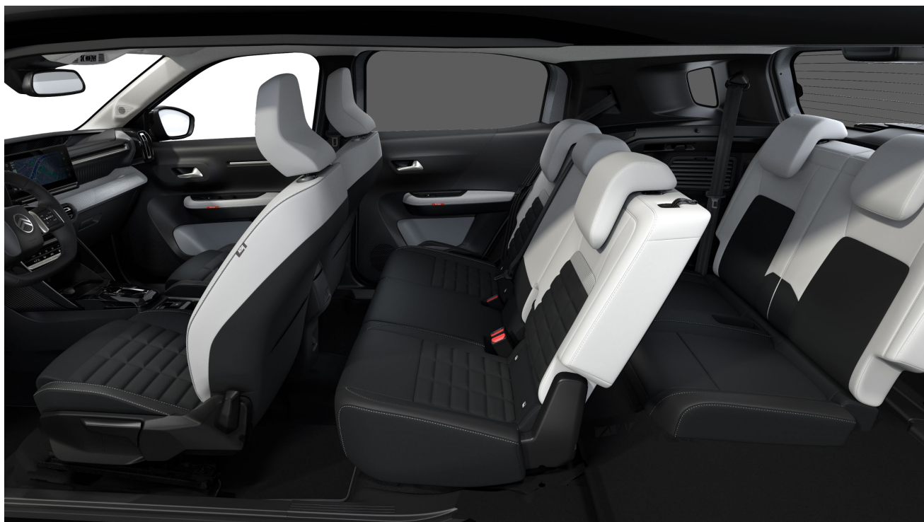
C3 Aircross 7-paikkaisena

* Sähköauton lisävarusteista ei peritä autoveroa. Autovero alkaen on laskettu mallisarjan pienimmällä CO2 arvolla, joka on 12.1 g/km