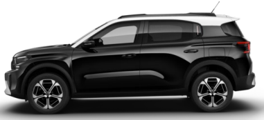
Noir Perla nera met.